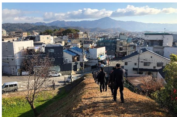
北区大宮土居町（玄塚下）の御土居

史跡指定されている9箇所のうち最も保存状態の良い「北区大宮土居町（玄塚下）」の御土居で、高さ4～5mの土塁と幅20mの堀を見学。