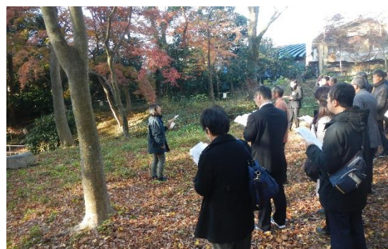
下鴨神社神宮寺跡

下鴨神社の境内整備に伴って発掘調査された神宮寺跡を見学。園池や瓦葺建物などについて解説を受ける。