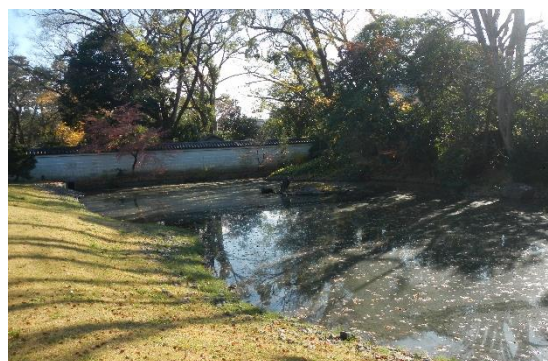
旧閑院宮邸跡庭園