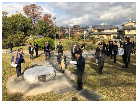
大仏殿跡緑地公園

豊国神社東側に整備されている「大仏殿跡緑地公園」を見学。その後、京都国立博物館の「平成知新館」建設時の発掘調査で見つかった方広寺南門・回廊の柱列を復元標示などの解説を受けた。