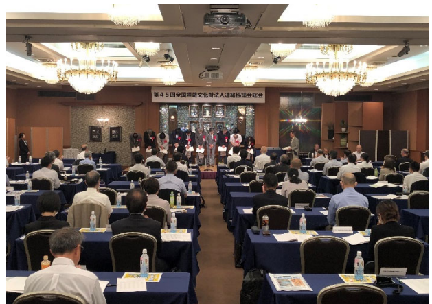
第1日目 会場の様子

Bコースは、「浜通り地方コース」として双葉郡富岡町にあるとみおかアーカイブミュージアムと東京電力廃炉資料館の視察を行いました。