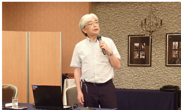
講演する近江主任文化財調査官