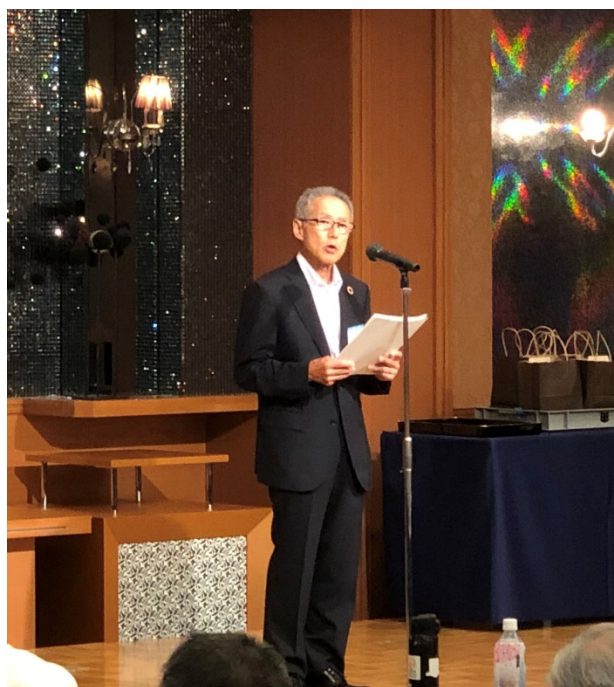
挨拶する全国埋蔵文化財法人連絡協議会会長

加盟法人におかれては、今後とも難しい組織運営が求められることと存じます。当連絡協議会の