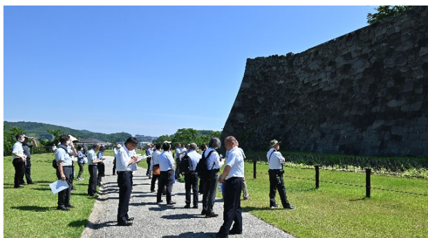
写真1 白河市小峰城跡の見学

小峰城跡の見学を終え、一行は栃木県と福島県の県境付近に位置する福島県文化財センター白河館(愛称 まほろん)へ移動しました(写真2)。